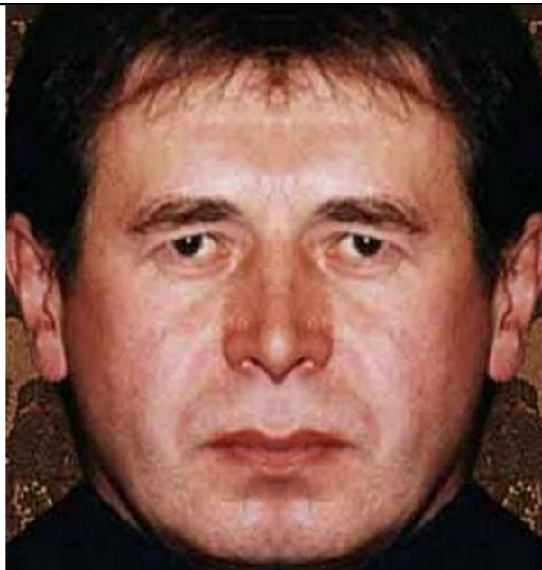
«Духовный портрет» (из 2-х правых половин)