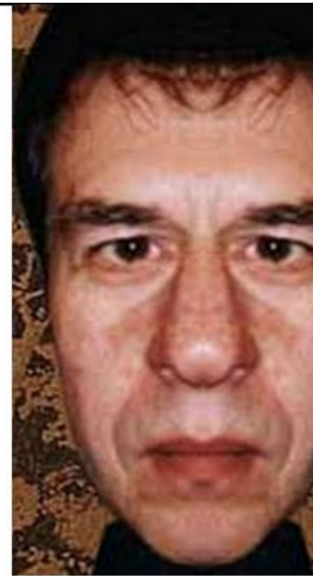
«Жизненный портрет» (из 2-х левых половин)